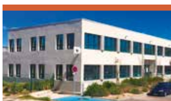
VITROLLES, FRANCE (Bouche du Rhône) Surface: 1000 m 2 Locataire: Pôle Emploi