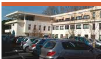
AVIGNON 1, FRANCE (Vaucluse) Surface: 2172 m 2 Locataire: Pôle Emploi