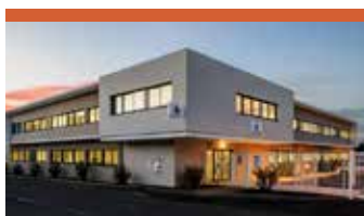
ISTRES, FRANCE (Bouche du Rhône) Surface: 1400 m 2 Locataire: Pôle Emploi