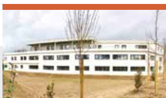
AVIGNON 2, FRANCE (Vaucluse) Surface: 2050 m 2 Locataire: Pôle Emploi